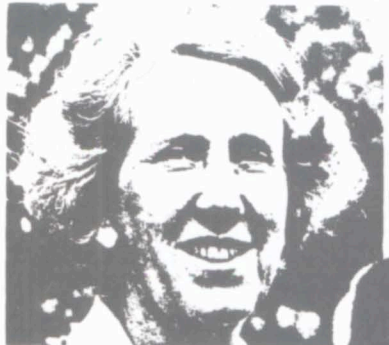
Från materialismen Slutligen vill jag peka på ännu missbrukat

Ju fler sådana chanser vi kan öppna för dem, desto mer krafter kommer loss som kan användas för ett bättre samhälle.